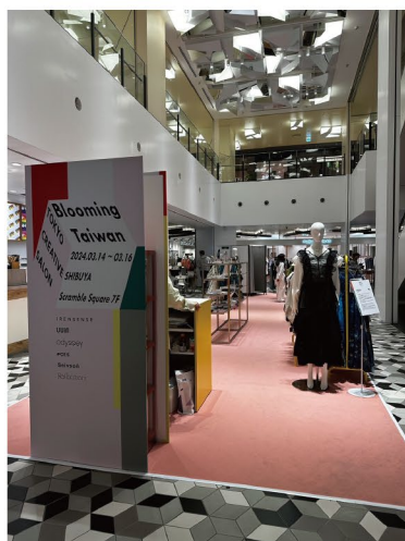
POP UP Store Record