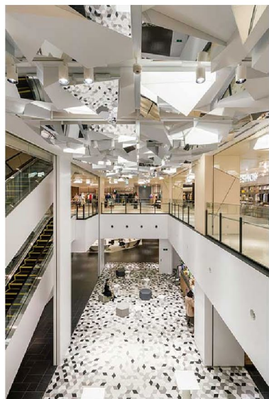
SHIBUYA Scramble Square 7F “L X 7” Event Space